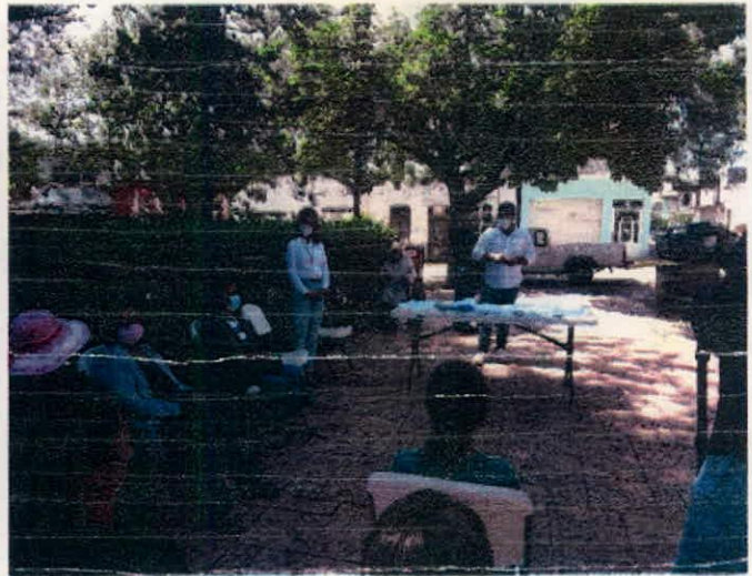
Reunión realizada en la plaza de la localidad de Tlalcosahua, Huejucar, Jalisco.